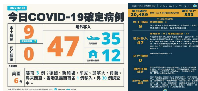
圖 1 2/28 疫情通報圖

(一) 2/28 本土病例 9 例、境外移入 47 例，死亡 0，2/28 累計確診（20,489 例）、累計死亡（853 例），死亡率: 4.16%。