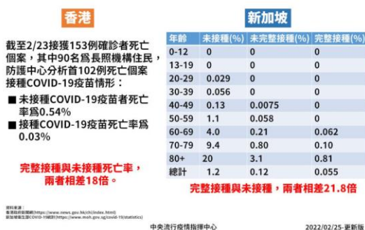
圖 5 香港及新加坡確診個案死亡 COVID-19 疫苗接種情形