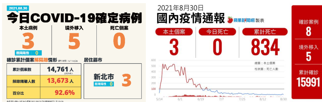
圖 1 8/30 本土確診新增數

(二) 8 月 30 日累計確診（15,991 例）、累計死亡（834 例）、死亡率 5.21%。8/22-8/30 當週桃園確診 1 例、台北市確診 6 例、新北市確診 21 例。