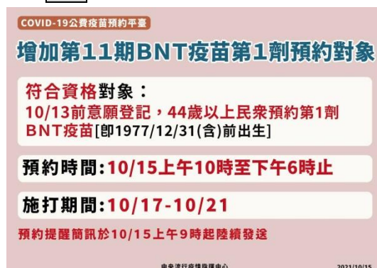
圖 2 第 11 期 BNT 疫苗預約對象