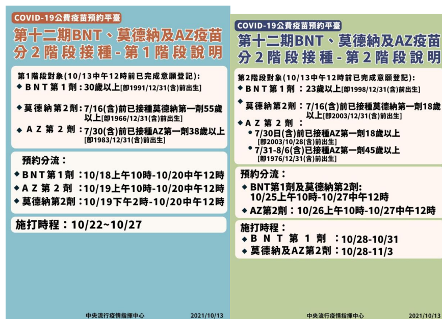
圖 3 兩階段接種規劃分流接種說明