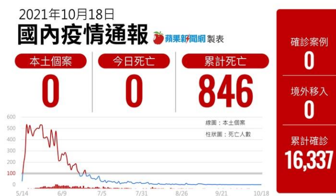
圖 1 10/18 疫情通報

10/18 本土 0 個案、0 境外移入、0 死亡，這是 4 月 8 日 以來， 睽違 193 天 ， 三個加零 ， 10/18 累計確診（16,337 例）、累計死亡（846 例），死亡率: 5.17%。