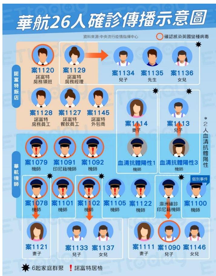
圖 3 COVID-19 華航感染關係圖

二、中央流行疫情指揮中心 4 月 29 日啟動諾富特飯店清空計畫及員工採檢, 共撤離 412 人至集中檢疫所, 飯店需清空、消毒和靜置 14 天。截至 5 月 1 日採檢 103 處房間環境結果都是陰性。